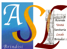
TABELLA DIETETICA PRIMAVERA-ESTATE Anno scolastico 2014-2015 Scuola dell'INFANZIA e PRIMARIA SAN PANCRAZIO S.no