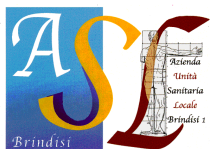
TABELLA DIETETICA PRIMAVERA-ESTATE Anno scolastico 2014-2015 Scuola dell'INFANZIA e PRIMARIA SAN PANCRAZIO S.no