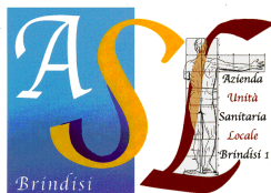
TABELLA DIETETICA PRIMAVERA-ESTATE Anno scolastico 2014-2015 Scuola dell'INFANZIA e PRIMARIA SAN PANCRAZIO S.no