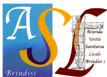
TABELLA DIETETICA AUTUNNO-INVERNO Anno Scolastico 2017-2018 Scuola dell'INFANZIA e PRIMARIA S. Pancrazio S. no (Br)