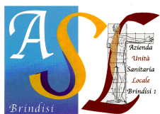
TABELLA DIETETICA AUTUNNO-INVERNO Anno Scolastico 2017-2018 Scuola dell'INFANZIA e PRIMARIA S. Pancrazio S. no (Br)