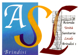
TABELLA DIETETICA AUTUNNO-INVERNO Anno Scolastico 2017-2018 Scuola dell'INFANZIA e PRIMARIA S. Pancrazio S. no (Br)