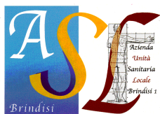
TABELLA DIETETICA AUTUNNO-INVERNO Anno Scolastico 2017-2018 Scuola dell'INFANZIA e PRIMARIA S. Pancrazio S. no (Br)